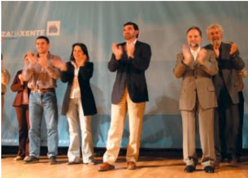
Peche do mitin electoral en Ferrol

mos claro que non iamos consentir gobernos populares e ali onde foi posíbel un goberno de coalición fixemo-lo e fomos leais e respetuosos cos acordos acadados. Sen embargo, non podemos dicir o mesmo dos nosos sócios, que en moitos casos, sobre todo onde nós estábamos en minoría, tentaron eclipsar e rendibilizar o noso traballo, non xogaron limpo sempre, chegando a boicotear moitas iniciativas que tiñan que sair adiante por consenso. Tiñamos esta experiencia acumulada e había que corrixi-la. Por iso, como o BNG é unha forza política que sempre está aprendendo, o que fixemos foi analizar o positivo e negativo deste tempo, concluímos e decidimos que non podíamos ser tan xenerosos.