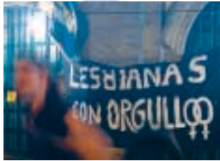
Festa e manifestación o 28 de xuño en Santiago

Unha delegación do BNG participou o sábado 28 de Xuño na manifestación unitaria que se celebrou en Santiago para conmemorar o Día do Orgullo Gaí . Baixo o lema "Respectémonos", os nacionalistas sumaron-se ás reivindicacións deste colectivo a prol do respecto a súa opción sexual e dunha educación que fomenta os valores da igualdade.