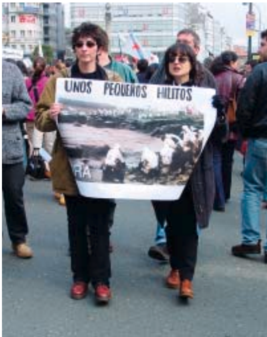
Manifestación na Coruña, 9 de febreiro 2003

mamentística e militarista. Efectivamente a súa posición internacional ten moito que ver coa súa política interior e o seu gosto por unha democracia claudicante. O antinacionalismo forma parte esencial da súa política interior en perfecto acorde coa súa asunción da globalización como arma xerárquica, discriminatória e opresiva. Quero recordar-lle que o nacionalismo, en particular o galego, responde ao postulado da democracia, o pacifismo e o internacionalismo. E é, aínda que non lle guste, unha contribución esencial e lexítima do pluralismo constitucional. O BNG é o polo oposto a privar a outros povos do seu autodomínio e do exercicio da súa vontade para cambiá-lo por un poder e unha vontade alleas. Non haberá auténtica Sociedade de Nacións se os povos non son donos de si mesmos.