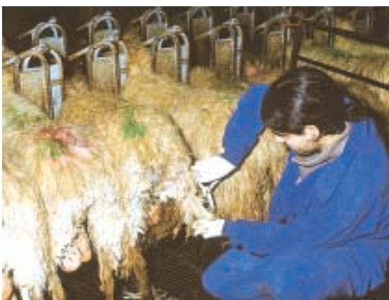
Escola de Pastores (Allariz). Destinada a formar futuros gandeiros na xestión de rebaños de ovino de leite e na fabricación de queixos de calidade.