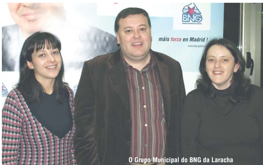
O Grupo Municipal do BNG da Laracha

veciños na vida política. Por iso o grupo de goberno utilizou a súa maioría para rexeitar a proposta do portavoz municipal do BNG de aprobar un regulamento de participación, sen utilizar argumentos de ningún tipo e sen entrar nen a debater o fondo do asunto.